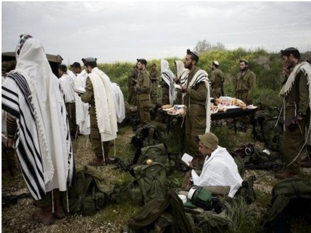
"הפרה הקדושה על שולחן הניתוחים" מסע כומתה גדוד