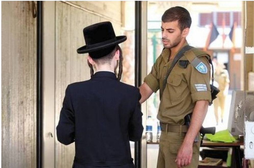
"החרדים יוכלו להיות מובלעת בתוך הצבא, לא מאוימת ולא

"התשובה שלי מתחלקת לטווח קצר וטווח ארוך. בטווח הקצר, גיוס החרדים יהיה הרבה יותר דומה למצב שרואים למשל בצבא ההודי ובאופן שבו הוא עובד עם החיילים הסיקים שלו. החרדים יוכלו להיות מובלעת בתוך הצבא, שמטופלת באופן נפרד, לא מאוימת ולא מאיימת. הבעיה העיקרית היא איך לגייס אותם, איך למצוא את האיזונים בין עולמם לבין חובתם האזרחית, ואיך לעשות זאת בחוכמה וברגישות, שתכבד אותם ואת המערכת גם יחד. הבעיה עשויה להתעורר בטווח הארוך. אם הצבא יהיה בעל גוון דתי חזק מאוד, ואם תהליכי ההדתה שאנו רואים היום משיכו מבלי שיינקטו כלפיהם הצעדים הנדרשים, קשה להעריך מה יהיו המשמעות של זה".