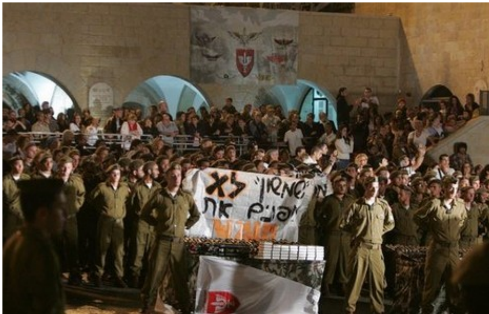
"קראתי את הידיעה ואמרתי לעצמי, יש פה בעיה". גדוד שמשון "לא מפנים ישובים"

תגיות: חיילים דתיים, צה"ל ד"ר ראובן גל , נורת הבקרה של ד"ר ראובן גל , מומחה ליחסי צבא וחברה, נדלקה בעקבות תמונה שפורסמה בעיתון לפני כמה שנים. נראו בה כמה מטירוני חטיבת כפיר, שהניפו שלט נגד פינוי יישובים יהודיים. "קראתי את הידיעה ואמרתי לעצמי, יש פה בעיה", מספר גל . "כבר בפינוי גוש קטיף חששנו מסרבנות, אבל אז זה היה סביב אירוע ממלכתי והיסטורי, וכאן זה היה בתוך שגרת הפעילות השוטפת. כחוקר, זה התפרש אצלי כמשהו אחר לגמרי. באתם הימים היו עוד איתותים שאישרו לי את תחושת הבטן, והתחלתי לבדוק את הנושא. הרגשתי שיש כאן תופעה שצריך לבחון, כי היא חדשה בהקשר של צבא-חברה".