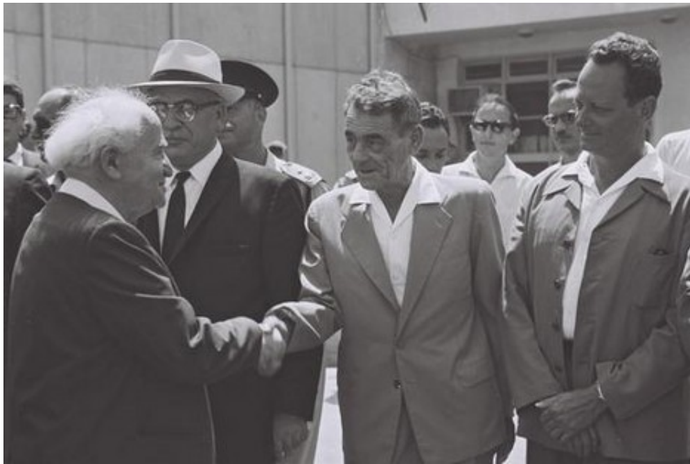
"ידע שעודף אידיאולוגיה בצבא עשוי ליצור בעיה, גם כשזו אידיאולוגיה 'שמאלית'". בן גוריון ויגאל אלון

"זו לא הטפה - שגם היא קיימת לפעמים, וזה חמור בפני עצמו - אבל היא עשוי להפוך להטפה בלי ששמים לב לכך. בצה"ל, בשונה מצבאות אחרים, המפקדים הם המחנכים, והמסרים שלהם הם מסרים מְחַבְרָתִים. לכן צריכים להיות מודעים לתהליכים האלה. אגב, יש גם טענה שתהליך ההדתה קיים בחברה הישראלית כולה, ולכן לא מבינים מהיכן התמיהה שלנו לגבי הצבא.