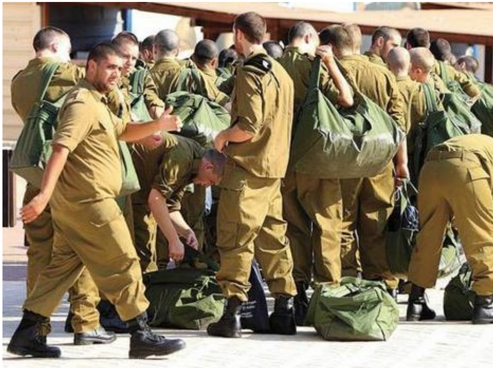
"תמיד אהבתי לטייל בארץ עם ספר תנ"ך ביד" חיילים בבקו"ם

לצד הישגיו המקצועיים, בשיחה פנים אל פנים הוא מתגלה כאדם צנוע, נעים סבר והליכות. "נולדתי בחיפה והתחנכתי שם", הוא מספר ל"דיוקן", בראיון ראשון מאז שפרסם את סדרת המחקרים על ההדתה. "עד כיתה ה' למדתי בבית הספר הדתי 'יבנה', בעיקר בגלל שהוא היה הסמוך ביותר לביתנו, אבל גם מכיוון שהוריי היו מסורתיים על גבול הדתיים.