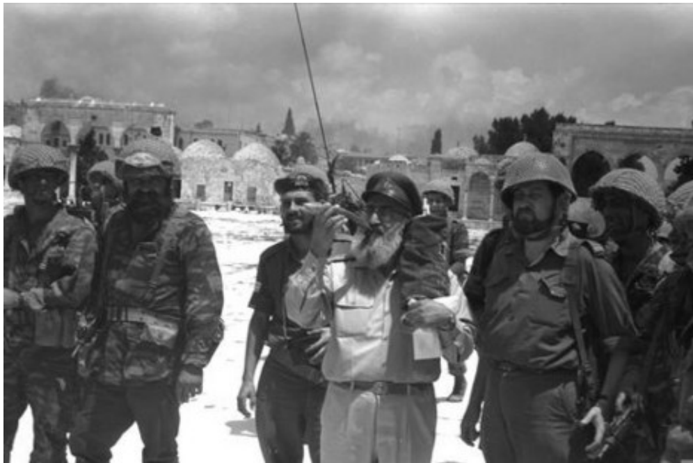
"היינו הראשונים שחרשו את חבלי הארץ המשוחררים, וזו הייתה חוויה מדהימה, שיכרון חושים". הרב גורן תוקע בשופר לאחר כיבוש העיר העתיקה

עם השחרור ממילואים חזר גל ללימודים, אך לא עבר זמן רב והוא מצא את עצמי שוב בשורות הצבא. "במלחמת ההתשה שכנעו אותי לשרת כפסיכולוג הראשי של חיל הים. מי שהיה צריך למלא את התפקיד נפטר לפתע מהתקף לב, ופנו אליי בבקשה להתגייס למאמצים של מערך המילואים, שנועד להקל על הצבא הסדיר בזמן המלחמה.