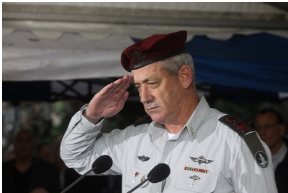
"קיומה של הכיפה ולא היעדרה מהווים שיקול בבחירת מפקדים ובקידום בצה"ל". הרמטכ"ל בני גנץ

"אני מבקש לנפץ את המיתוס שהחל להשתרש לאחרונה – לא קיומה של הכיפה ולא היעדרה מהווים שיקול בבחירת מפקדים ובקידום בצה"ל (...). פעמים רבות אינני יודע כלל אם המפקד שבו מדובר הוא חובש כיפה או לא, והדבר כלל אינו מעסיק אותי. מגמת העלייה בנוכחותה של הדת בשורות הפיקוד, אם כן, מהווה בעיניי ביטוי לתהליך טבעי ורחב יותר בחברה רב-גונית ודינאמית" (בין הכיפה לכומתה, אפילו, דבר הרמטכ"ל בני גנץ).