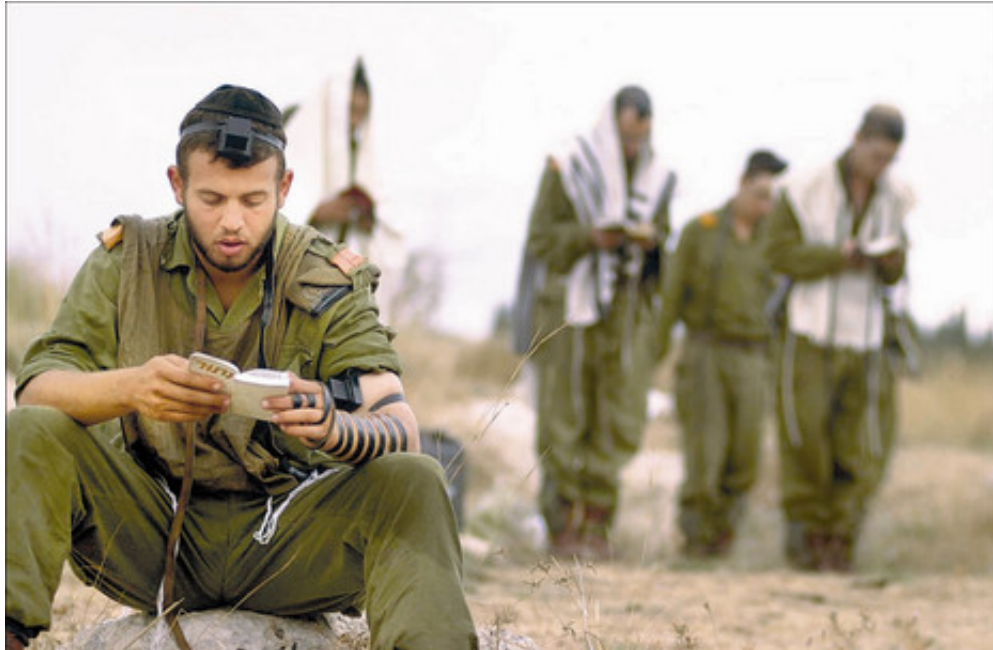
זו לא בעייתית לכשעצמה, אבל באופן מובהק יש כאן פוטנציאל של בעייתיות"

לראשונה נבחנת התופעה בכלים מקצועיים, בעזרתם של לא פחות מעשרים חוקרים מדיסציפלינות שונות – היסטוריה, פילוסופיה, כלכלה, סוציולוגיה, פסיכולוגיה וספרות - כל חוקר וארגז הכלים שלו. התוצאה היא דיון רב-קולי מקיף ומעמיק, כאשר חלק מן הקולות 'מכבדים' וחלקם 'חושדים'.